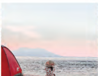
ΑΡΧΕΣ ΤΟΥ SLOW TOURISM