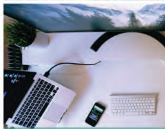
ΕΡΓΑΛΕΙΑ ΤΟΥ DIGITAL MARKETING