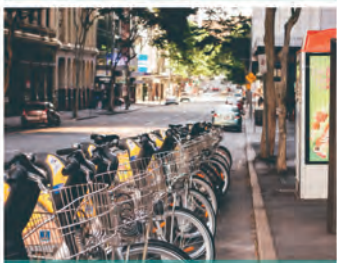
ΕΝΕΡΓΕΙΕΣ ΓΙΑ ΚΥΚΛΙΚΗ ΟΙΚΟΝΟΜΙΑ