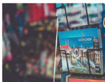
ΝΕΕΣ ΤΑΣΕΙΣ ΤΟΥ ΤΟΥΡΙΣΜΟΥ