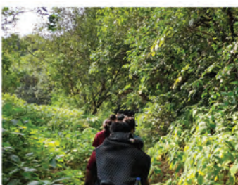
ΑΡΧΕΣ ΤΟΥ ΟΙΚΟΤΟΥΡΙΣΜΟΥ