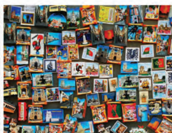
ΠΡΑΣΙΝΑ ΕΠΑΓΓΕΛΜΑΤΑ ΣΤΟΝ ΤΟΥΡΙΣΜΟ